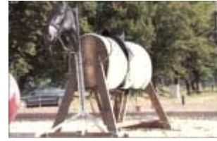
Auch wenn es sich noch so sehr bemüht, ein echtes Pferd wird niemals daraus.