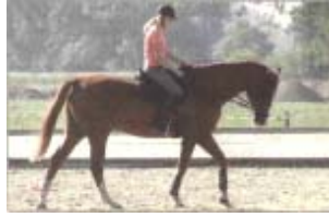
Konzentriert sitzt Aino Aminoff auf dem Pferd. Die Finnin genoss am Freitag die Übungsstunde.